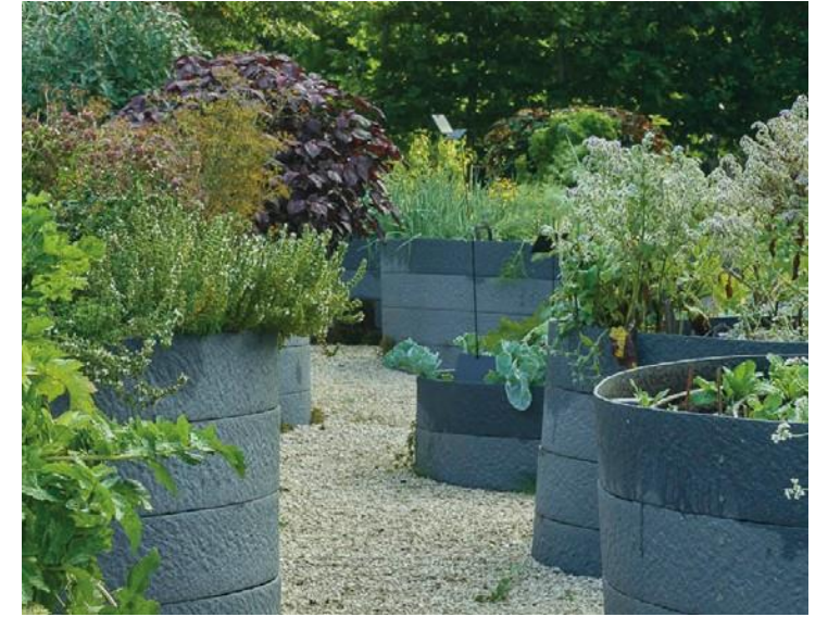
theetuin / kruidtuin